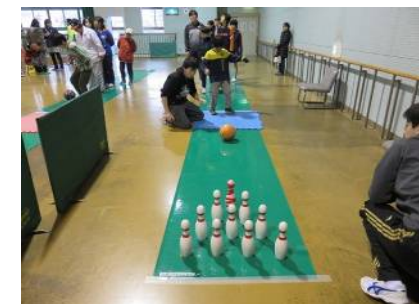
キックボウリング