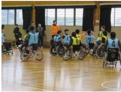
体験会(車いすバスケットボール)