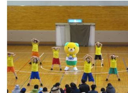
オープニングセレモニー(愛媛大学ダンス部)