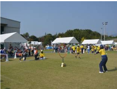
フライングディスク(アキュラシー)