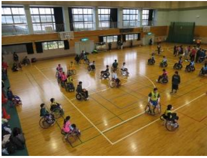
体験会(車いすバスケットボール)