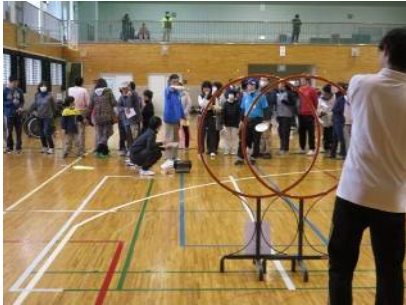
体験会(フライングディスク)