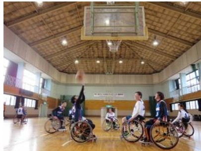
車いすバスケットボール試合観戦