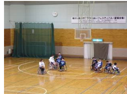
車いすバスケットボール試合観戦