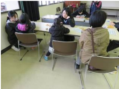
みきゃんグッズ作り