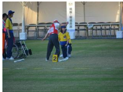
フライングディスク(ディスタンス)