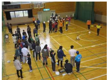
体験会(フライングディスク)